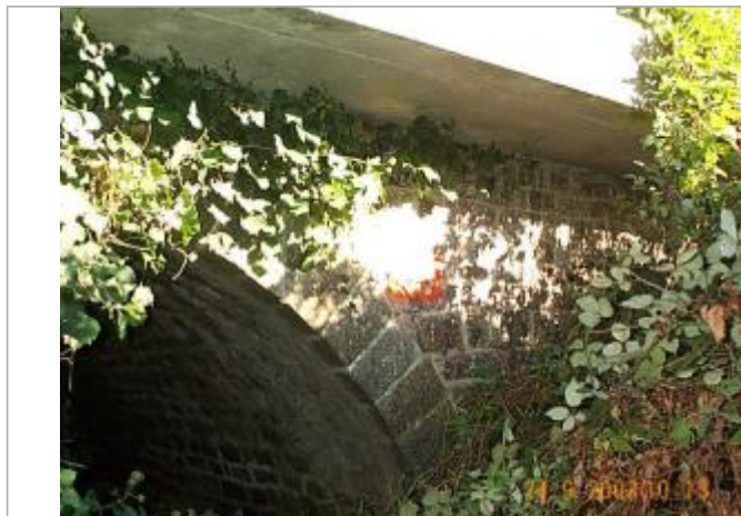
Photo du repère en 2014

SOURCE DE REPÉRAGE : RECENSEMENT DE REPÈRES DE CRUES ISSUS DE LA BASE DE DONNÉES GÉODÉSIQUE DE L'IGN - 27/02/2017