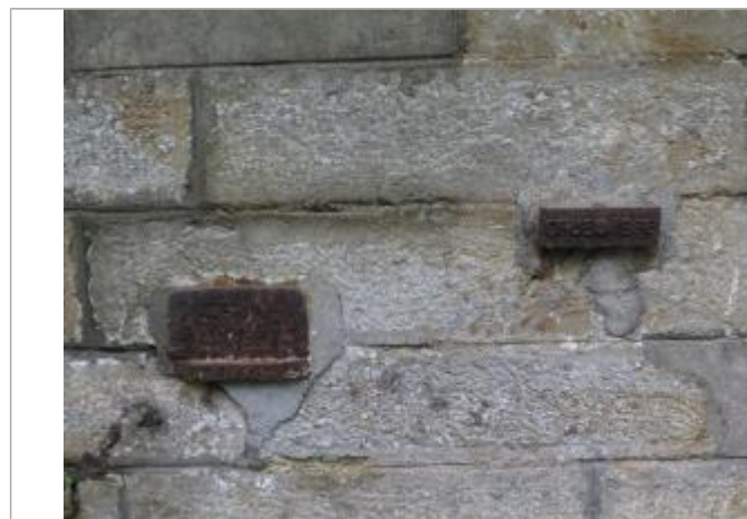
visite de contrôle le 17 octobre 2018 par le SPC VCB - photo des 2 plaques 1936 et 1966