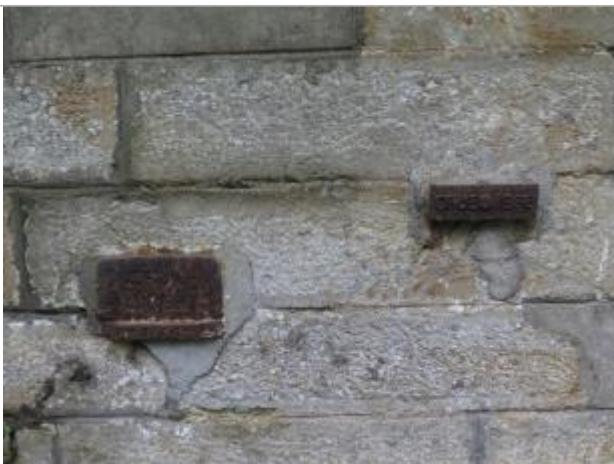
visite de contrôle le 17 octobre 2018 par le SPC VCB - photo des 2 plaques 1936 et 1966

Altitude calculée de l'eau (en m) : 62.8558