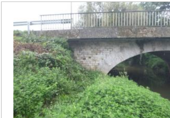
Vue du site amont du pont