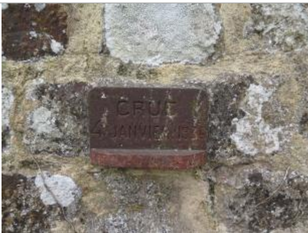
Repère lors de la visite du SPC VCB le 17 octobre 2018

Altitude calculée de l'eau (en m) : 46.682