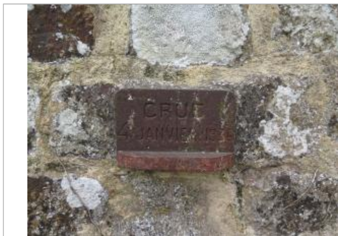
Repère lors de la visite du SPC VCB le 17 octobre 2018

Altitude calculée de l'eau (en m) : 46.682