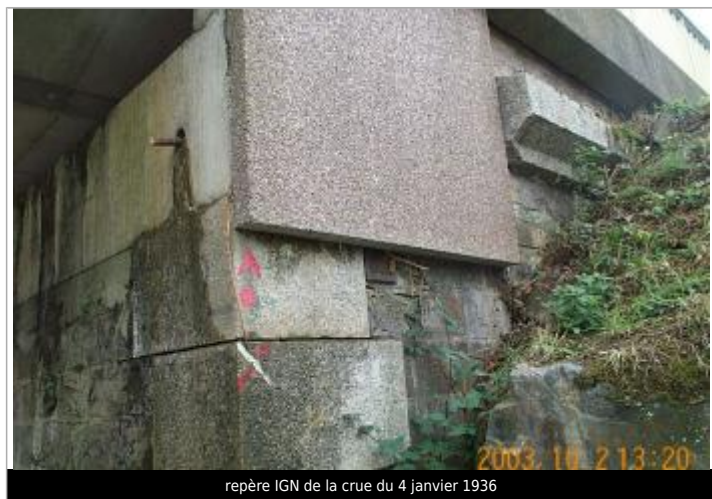
repère IGN de la crue du 4 janvier 1936

SOURCE DE REPÉRAGE : RECENSEMENT DE REPÈRES DE CRUES ISSUS DE LA BASE DE DONNÉES GÉODÉSIQUE DE L'IGN - 27/02/2017