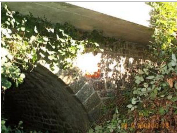
Photo du repère en 2014

Altitude calculée de l'eau (en m) : 38.225