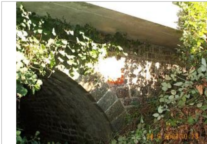
Vue du site en 2014 par l'IGN