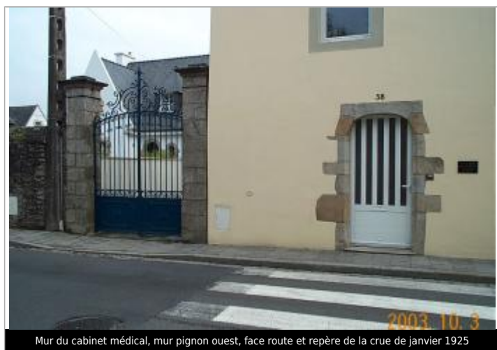
Mur du cabinet médical, mur pignon ouest, face route et repère de la crue de janvier 1925