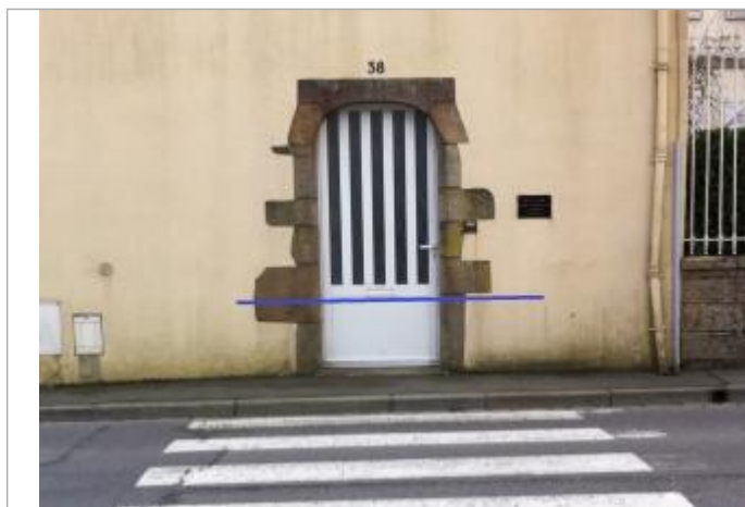
porte d'entrée au 28 rue Bremond d'Arz

SOURCE DE REPÉRAGE : CAMPAGNE DE TERRAIN DHE 2015 - 26/02/2015