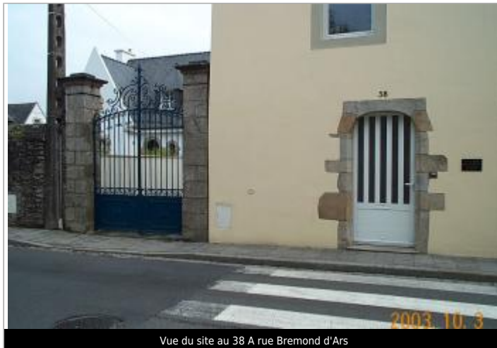
Vue du site au 38 A rue Bremond d'Ars