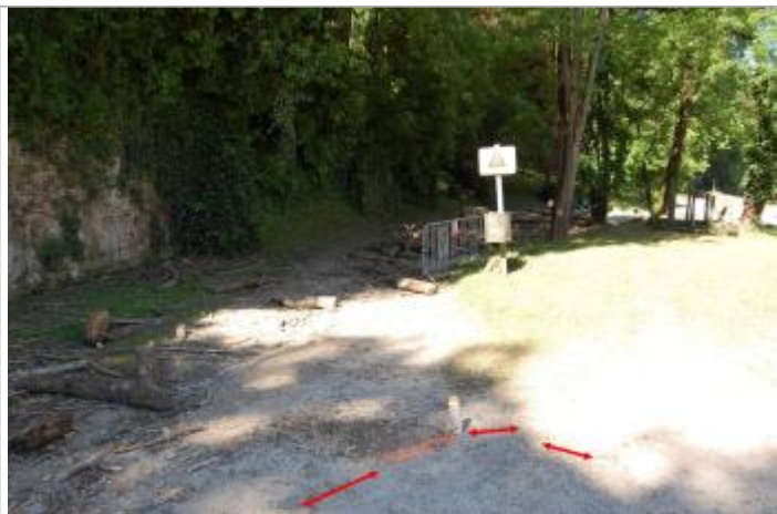
Vue du repère - Géosphair

Altitude calculée de l'eau (en m) : 98.2