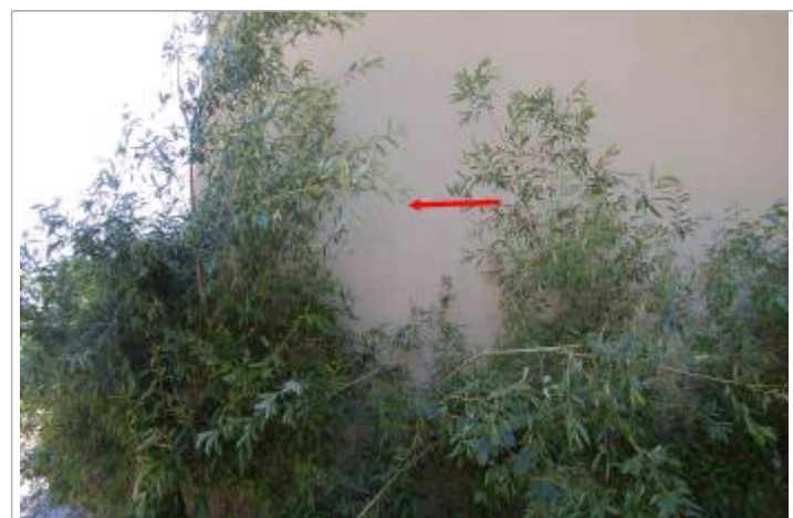
Vue du repère - Géosphair