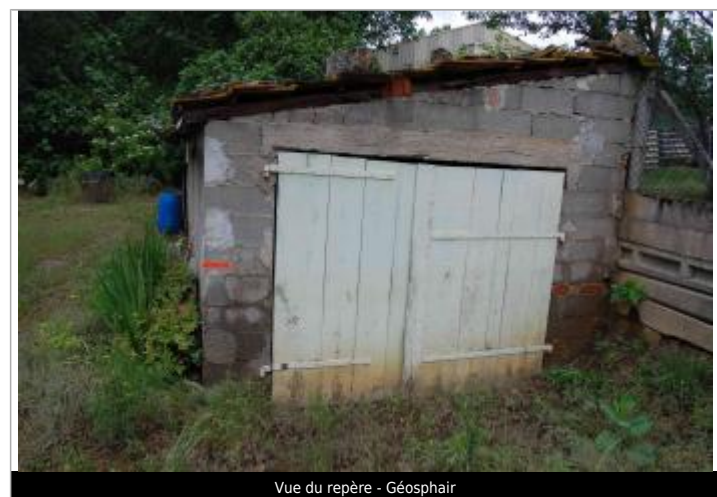
Vue du repère - Géosphair