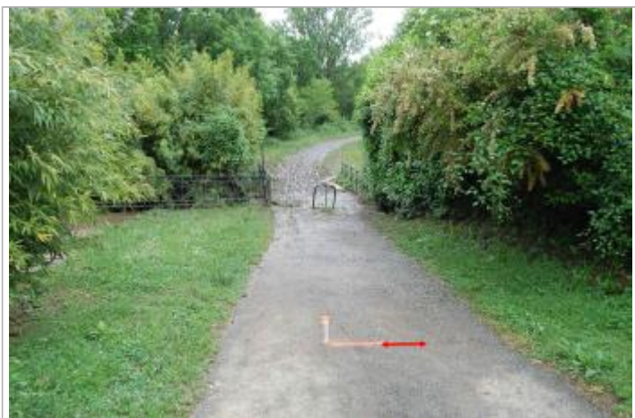
Vue du repère - Géosphair