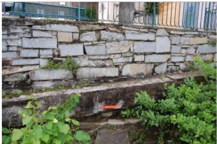
Vue du repère - Géosphair

Altitude calculée de l'eau (en m) : 213.61