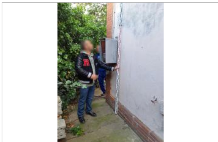
Photo du repère - mesure 2,30 m