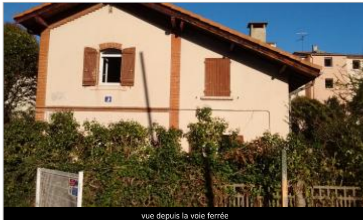
vue depuis la voie ferrée