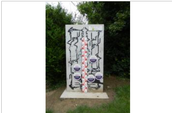
RC Mériel - ruelle du Lavoir