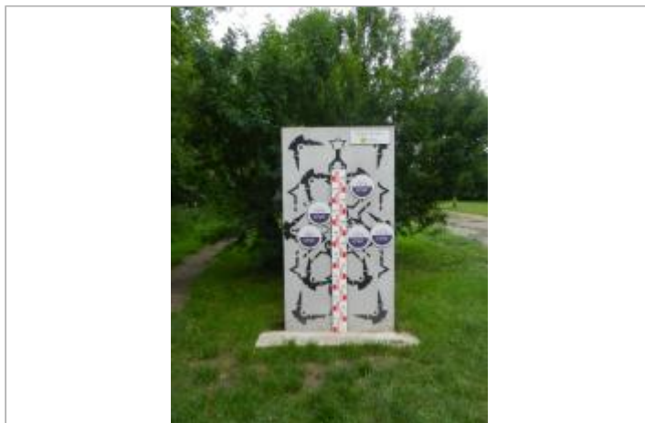
RC Mériel - rue du Bac

Coordonnées WGS84 : X: 2.19158039 / Y: 49.07251560 Coordonnées RGF93 (Lambert 93) X: 640930.09 / Y: 6886153.8 Coordonnées RGF93 (ETRS89) : X: 2.1915804 / Y: 49.0725156 Code Hydro: H---0100 Rive de référence: Gauche