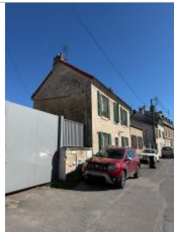
Vue du site et des repères