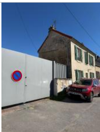
Vue du site et des repères

Altitude calculée de l'eau (en m) : 24.91 m