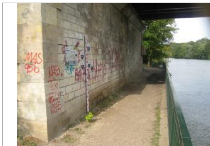
Photo des repères