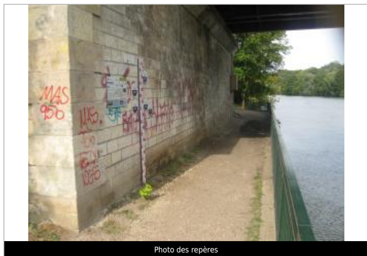
Photo des repères