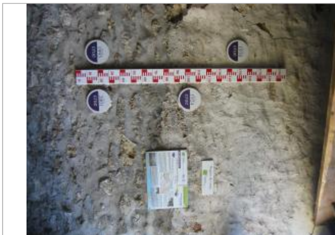
RC Jouy-le-Moutier n°1

Coordonnées WGS84 : X: 2.04946210 / Y: 49.01598700