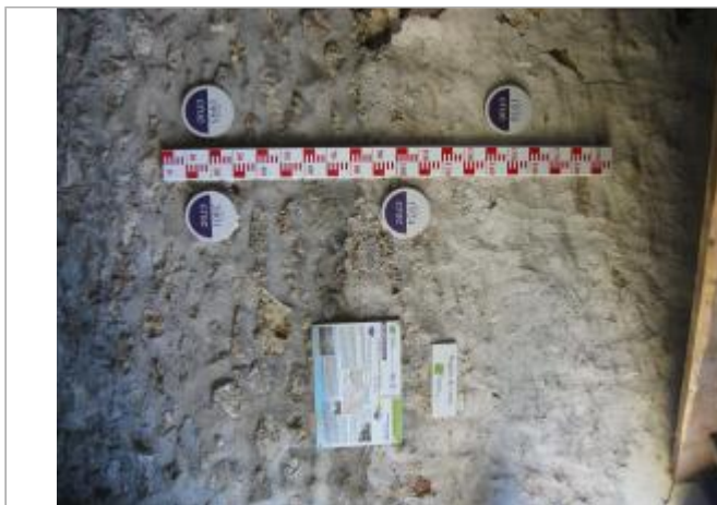
RC Jouy-le-Moutier n°1

Coordonnées WGS84 : X: 2.04946210 / Y: 49.01598700