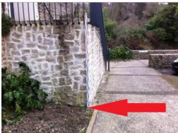
Pied du terre plein au droit de l'escalier

Altitude calculée de l'eau (en m) : 5.59