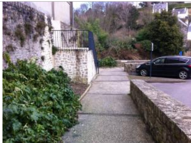
Vue générale du site - parking coté cinéma