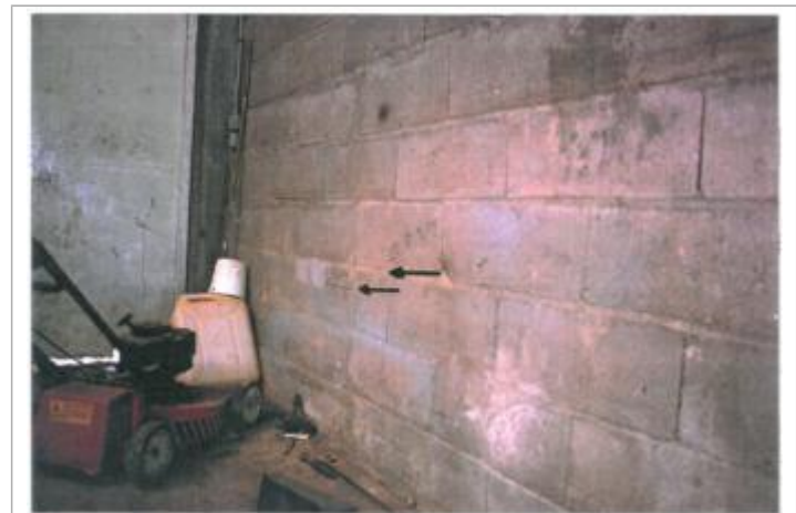
Repère de la crue de du 12 juin 1977

GÉNÉRAL Code : CE_ARN_R_114_2 Date de mise à jour : 19/02/2018 Auteur : A. Bontemps - Cerema Normandie-Centre