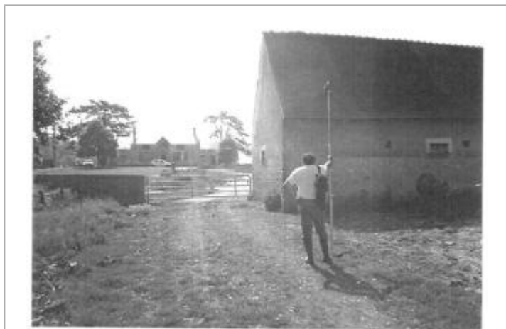
Repère de la crue de 1977