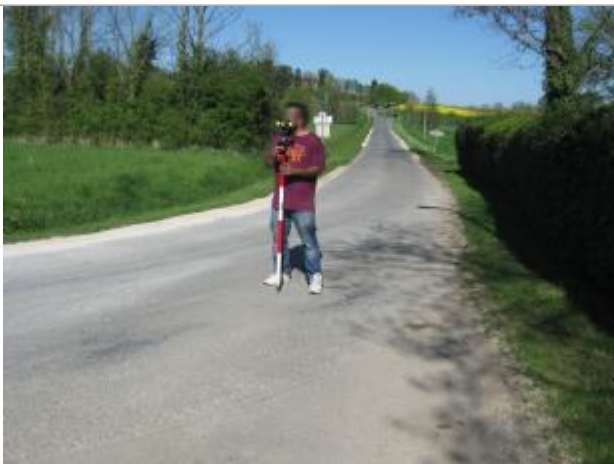
Repère de la crue de 1977

Altitude calculée de l'eau (en m) : 125.84 m