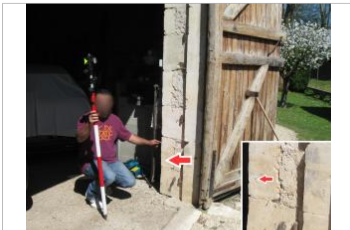
Site et repère