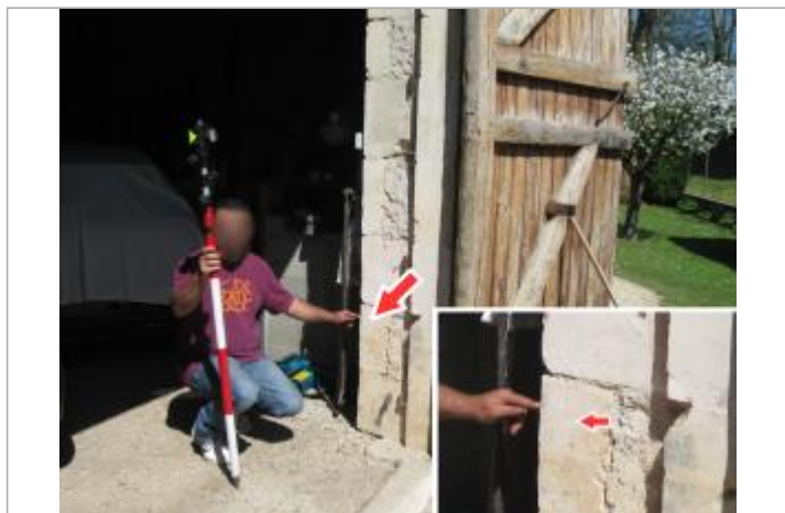
Repère de la crue de 1910

Maximum de l'inondation : Non renseigné Visibilité : Non État du repère : Bon Pérennité : Longue Repère calculé : Non renseigné PHEC : Non renseigné