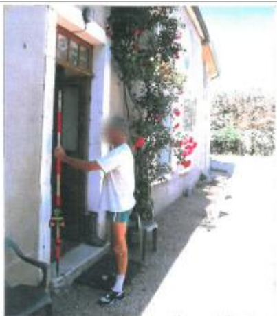
Repère de la crue de 1977

Altitude calculée de l'eau (en m) : 115.89