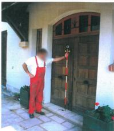
Repère de la crue de 1977

Altitude calculée de l'eau (en m) : 110.17