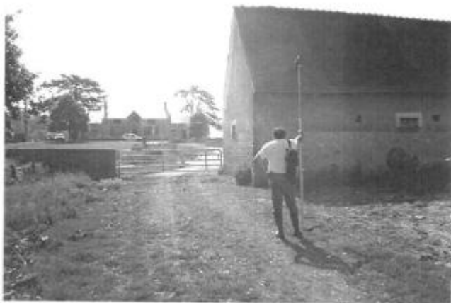
Repère de la crue de 1977

Altitude calculée de l'eau (en m) : 110.1