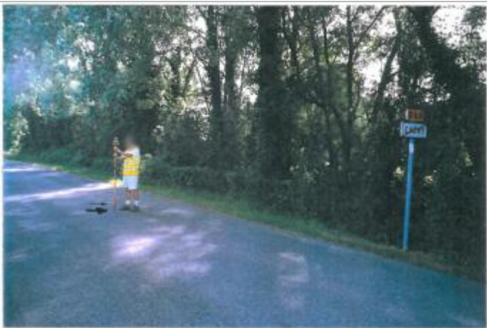
Repère de la crue de 1977

Altitude calculée de l'eau (en m) : 108.72