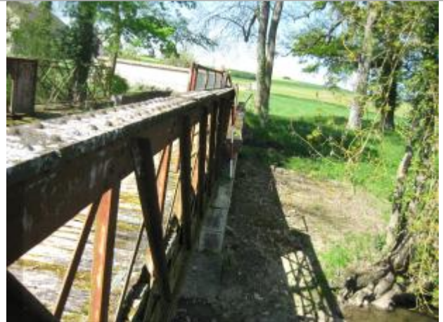
Site et repère de la crue de 2001

Coordonnées WGS84 : X: 2.07907500 / Y: 47.01489300