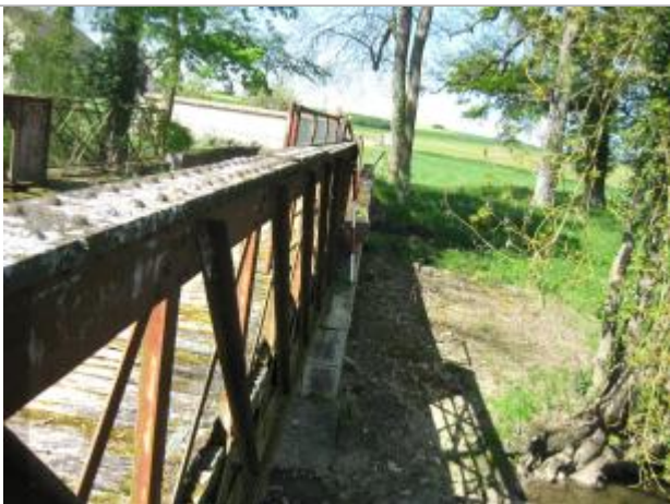
Repère de la crue de 2001

Altitude calculée de l'eau (en m) : 118.29