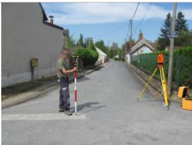
Repère de la crue de 1977

Altitude calculée de l'eau (en m) : 124.97