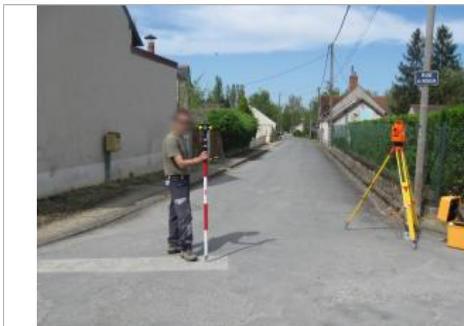
Site et repère de la crue de 1977

Coordonnées WGS84 : X: 2.11937700 / Y: 46.99439100