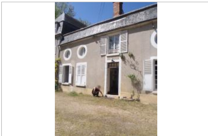
Site et repère de la crue de 1977