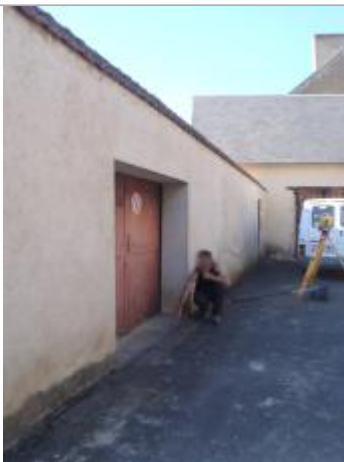
Repère de la crue de 2001

Altitude calculée de l'eau (en m) : 159.16