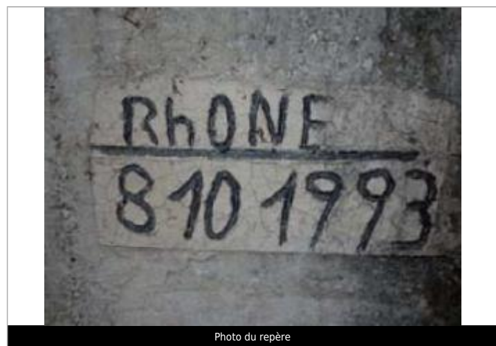
Photo du repère

GÉNÉRAL Code : RH1_R_07rochem03_2 Date de mise à jour : 24/04/2018 Auteur : SPC GD