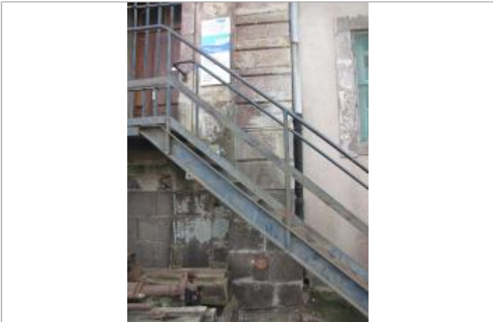
mur du bâtiment VNF