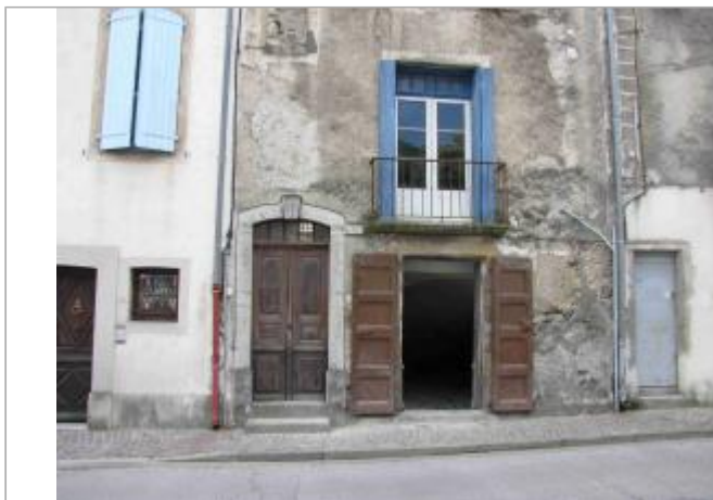
façade de la maison