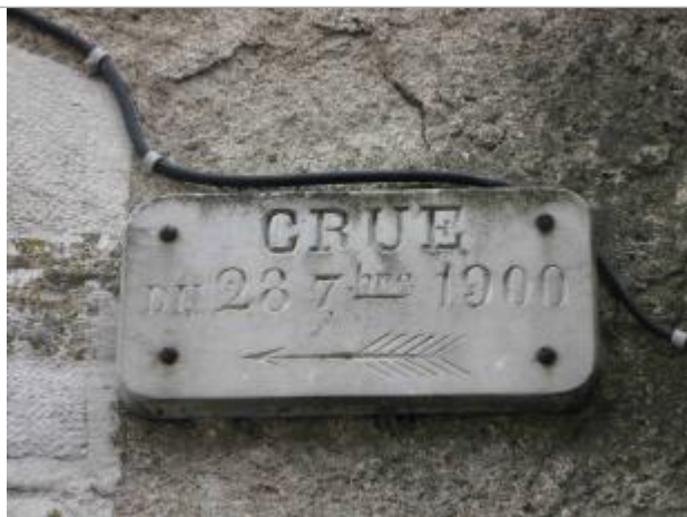
plaque au niveau du haut de la porte d'entrée