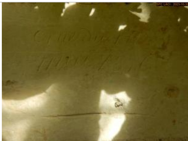
Vue du repère en 2023

Altitude calculée de l'eau (en m) : 59.411 m