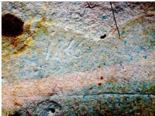
Vue du repère en 1993