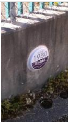
plaque Juillet 1980