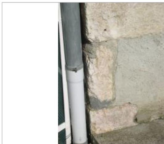
Point de repère

Texte : Au niveau du collier de la descente de gouttière