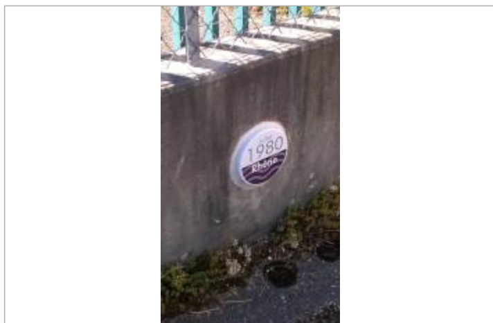
plaque Juillet 1980