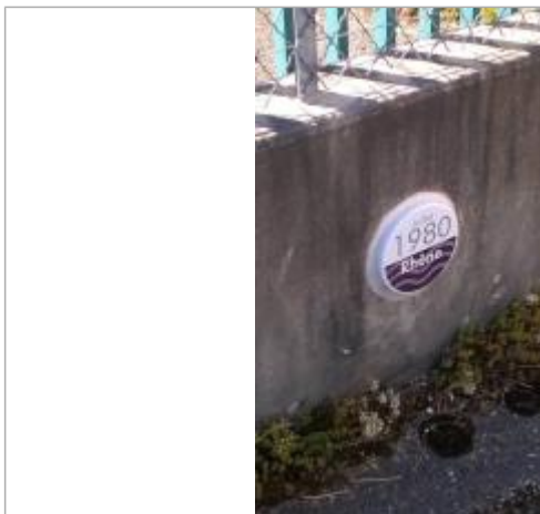
plaque Juillet 1980