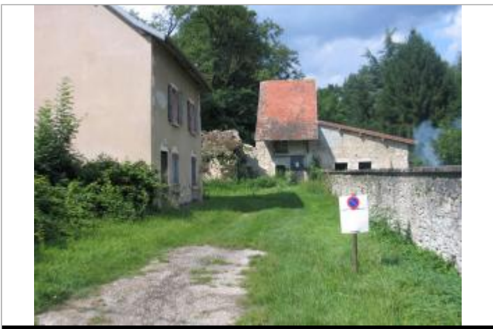
sur le mur du bâtiment au fond de la cour

GÉOLOCALISATION Coordonnées WGS84 : X: 5.53768630 / Y: 45.70994700 Coordonnées RGF93 (Lambert 93) X: 897400.22 / Y: 6515435.6 Coordonnées RGF93 (ETRS89) : X: 5.5376863 / Y: 45.709947 Code Hydro: V---0000 Rive de référence: Gauche