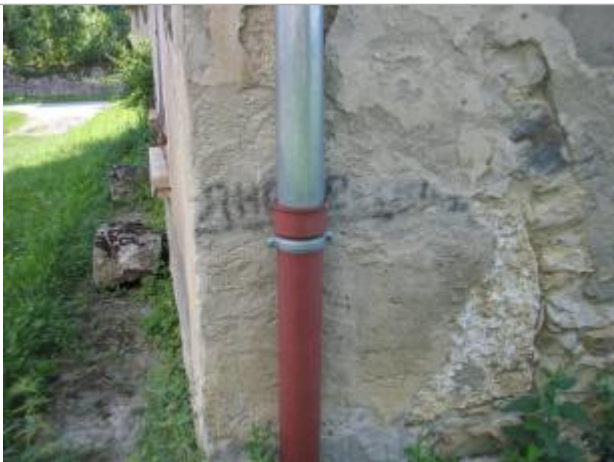
sur le mur du bâtiment au fond de la cour

Système altimétrique : NGF IGN 1969 (système normal)