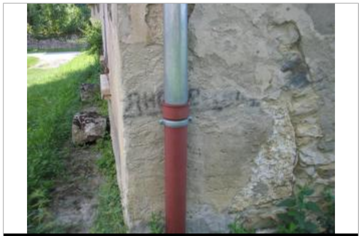
sur le mur du bâtiment au fond de la cour

GÉNÉRAL Code : RH3_R_BRAN_4_1944 Date de mise à jour : 12/03/2020 Auteur : SHR