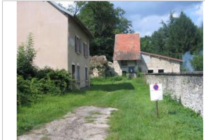
sur le mur du bâtiment au fond de la cour