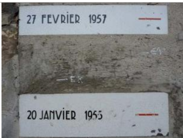
Photo du repère

Différence entre le niveau d'eau et la référence (en m) : 1.420 m