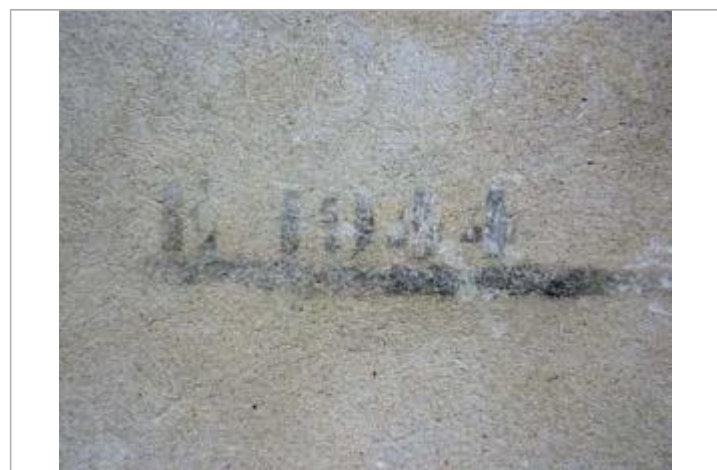
Photo du repère