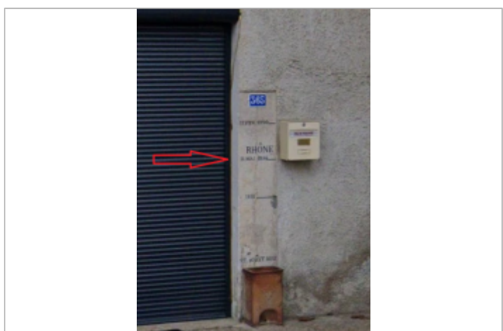
Vue du repère

GÉNÉRAL Code : RH2_R_01lagnie01_3 Date de mise à jour : 21/08/2025 Auteur : SPC RAS