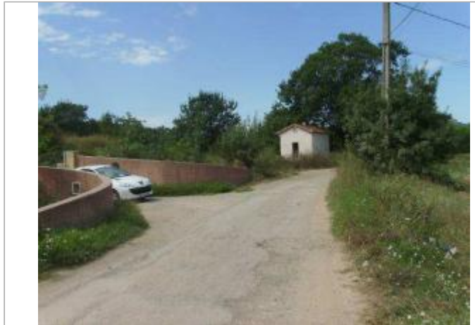
Vue générale

Coordonnées WGS84 : X: 6.66523100 / Y: 43.45293200