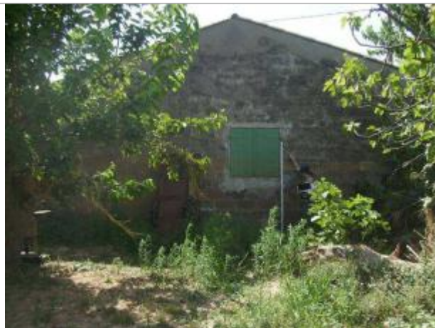
Vue générale