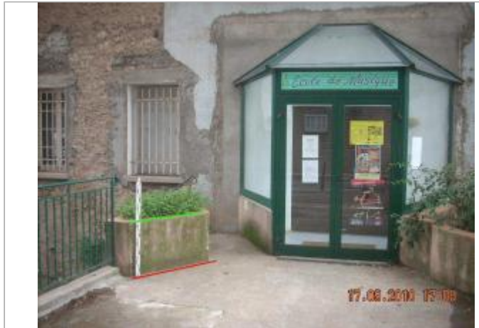
Vue générale - Auteur : GINGER