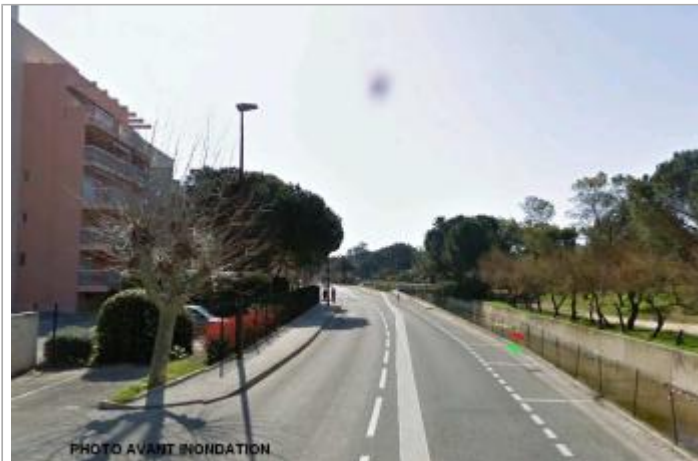
PHOTO AVANT INONDATION