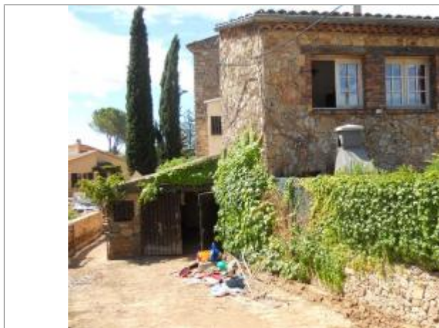
Vue du site - Auteur : SAFEGE