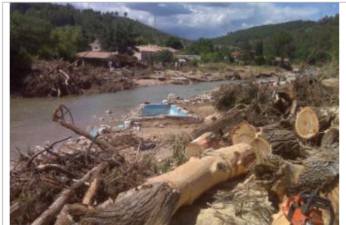
Vue du site - Auteur : SAFEGE

Coordonnées WGS84 : X: 6.42456200 / Y: 43.45422300